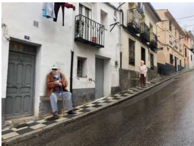
C/ Diego Ramírez de Villaescusa

A su vez, queremos realizar paseos por los distintos barrios de la ciudad; para que sus vecinos, vecinas y toda persona interesada pueda demandar un sitio de descanso. Un lugar donde colocar un banco que beneficie a todo el barrio.