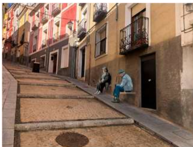
C/ General Santa Coloma

Montajes realizados por Jorge Martínez García